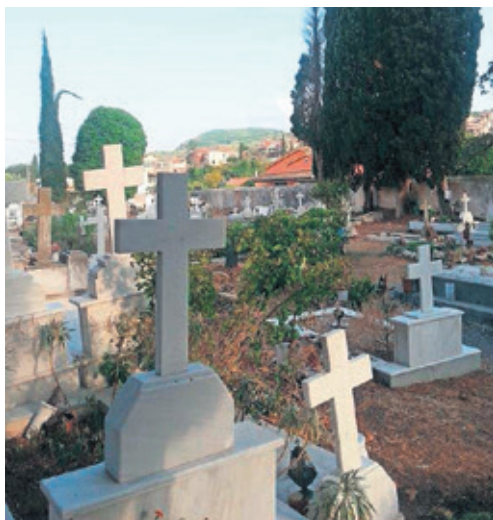
Letzte Ruhestätte: eine Momentaufnahme.

Einen Tag später ist am frühen Abend die Strasse leer. Wir betreten nun den Friedhof durch eine Türe in der hinteren Mauer. Alle