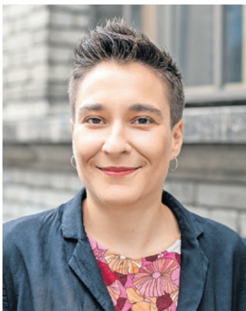
Rahel Ruch.

Ja, aber der Bundesrat hat viel Spielraum, um zu definieren, für wen diese Sorgfaltspflicht