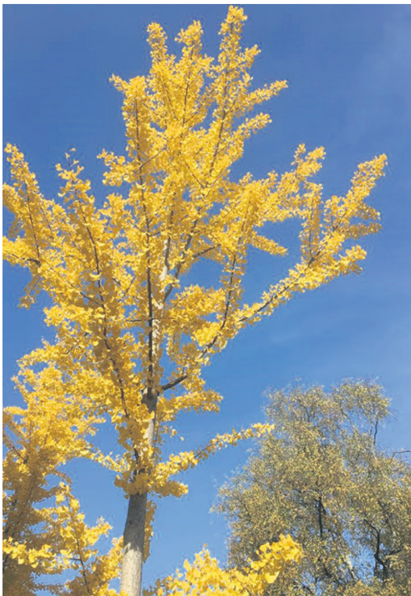
Gott schenkt uns die Kraft, die wir brauchen!

Ich vertraue auf Dich, Vater, und auf Deinen geliebten Sohn Jesus, auf Maria unsere liebe Mutter, und auf die Fürsprache Deines Dieners Carlo Acutis. Amen!